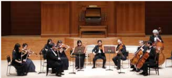
▲日本フィルハーモニー交響楽団(弦楽アンサンブル)