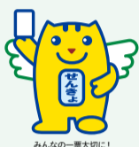
▲選挙のめいすいくん