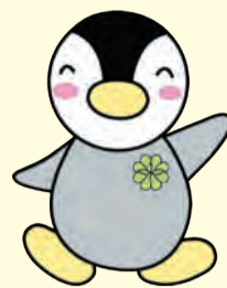
▲東京都民生委員・児童委員 キャラクター ミンジー

民生委員・児童委員は、厚生労働大臣から委嘱された無報酬のボランティアです。社会福祉全般にわたる地域の身近な相談役として活動しています。5月12日(日)の「民生委員・児童委員の日」に合わせ、日頃の活動を紹介するパネル展を開催します。