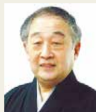
▲人間国宝・山本東次郎

開午前11時～正午・午後1時30分～2時30分 出演 人間国宝・山本東次郎(おはなし)ほか 対 小中学生とその保護者 定 各108名(抽選)