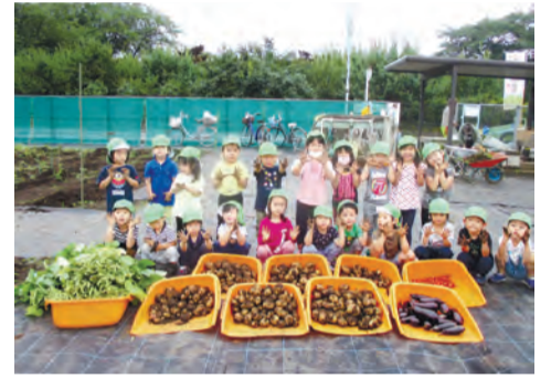
▲昨年度の優秀作品

参 ☎同委員会事務局 ☎5347-9136 ☎応募作品は返却しません。個人を特定できる場合は、事前に写っている人の承諾が必要。入賞作品はネガなどの提出をお願いするなど、杉並の農業振興に関するイベント等に利用することがあります