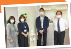
▲アルコールスタンド寄贈時の様子

寄贈された物品は、新型コロナウイルス感染症の予防・拡大防止に活用します。—— 問い合わせは、総務課総務係へ。