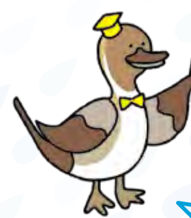
オナガカモ先生 ※善福寺川に生息。