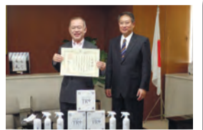
▲除菌消臭水寄贈の様子