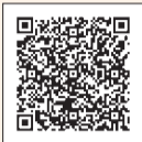
表1のとおり。詳細は、「防災用品あっせんのご案内」(区役所、区民事務所、地域区民センターなどで配布)や区ホームページ(右2次元コード)をご覧ください。また、防災課(区役所西棟6階)に見本を用意しています。