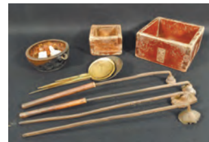
▲油つぼ、升、丸さじ、焼判

柏屋が煎餅の製造を機械製造に切り替える前に使用していた煎餅製造道具をはじめとした干菓子類製造道具です。高度経済成長期以降の機械技術の進歩と生活様式の変化により急激に失われていったいわゆる手仕事の道具であり、杉並の諸職を考える上で重要な資料といえます。