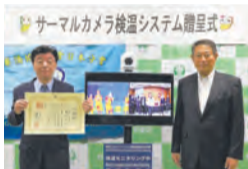
▲サーマルカメラ検温システム贈呈の様子