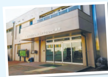
▲コミュニティふらっと東原

1月に開設した新たな地域コミュニティ施設「コミュニティふらっと」を、地域の皆さんにご紹介します。