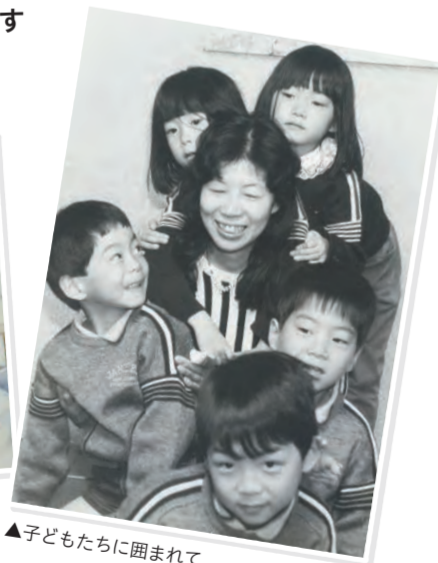
▲子どもたちに囲まれて