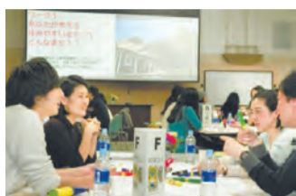
▲過去の懇談会の様子

策定にあたり、若い皆さんの意見をお聞きするため、グループ形式による区民懇談会を開催します。