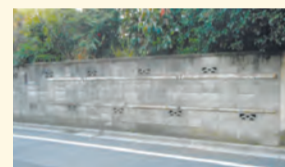
▲助成対象のブロック塀