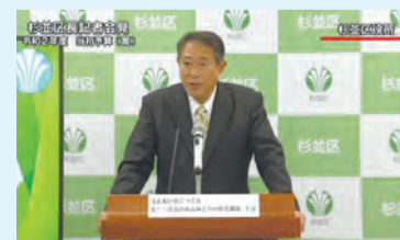
▲昨年度記者会見の様子