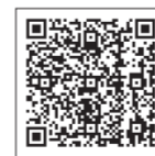
▲居宅サービスを利用した方