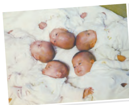
▲生後1カ月。未熟児で生まれた五つ子

私の時代には、多胎児に対する行政の支援というのはほとんどなかったように思います。もしあったとしても簡単には情報が届かない時代でした。25歳で結婚したもののなかなか子どもを授からず、長く不妊治療を続けて授かった命。双子の可能性は高いとあらかじめ聞いていましたが、まさか五つ子とは想像もしませんでした。検診でお医者様が超音波で確認しながら「双子かな？ あれ？ やっぱ三つ子だ」「いや、4人いるな。大変だ5人だよ、心臓が5つあるよ…！」と慌て始めて。それを聞いた私も頭が真っ白になりました。当時は医療も今と違いましたから、0か5か、つまり全員産むか一切産まないかという決断を迫られました。「せつかくここまで頑張ってきたのだから0より5を選ぶよ」という夫の言葉に背中を押されて、五つ子を出産する決心をしました。