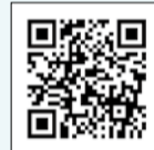
▲モバイルレジホームページ

専用のアプリをスマートフォンでダウンロードし、納付書に印字されたバーコードをスキャンすることで、インターネットバンキングを利用して納付することができます。