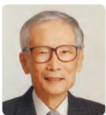
こんどう じゆん 近藤 淳氏