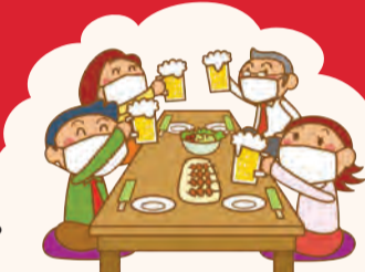
▲会食中もマスクの着用を