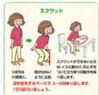
▲「健康づくり実践ガイド集ver3.0」より