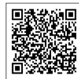
▲健康づくり実践ガイド集