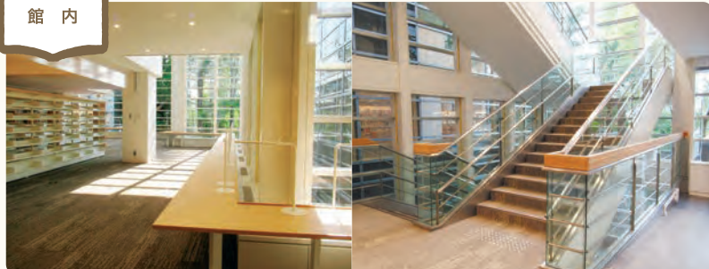
▲窓際にはカウンター机を配し、閲覧席を増やしました。