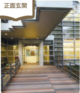
▲木のスロープを設置しました。