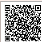
元年度ご意見・ご要望の「杉並区基本構想 (10年ビジョン)」に掲げる目標および施策別件数