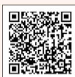
▲店舗家賃負担助成金

新型コロナウイルス感染症の影響を受けた中小事業者への支援として実施している、店舗家賃負担助成金・廃業経費補助金の申請期限は8月31日（消印有効）です。締め切り直前は、手続きに時間がかかる場合がありますので、早めの申請にご協力ください。申請方法などの詳細は、区ホームページ（右2次元コード）をご覧ください。