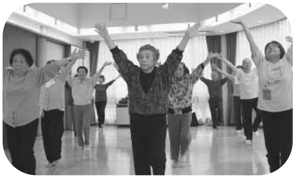
音楽にあわせ健康エアロビクス(ゆうゆう梅里堀ノ内館)

高齢になっても、いきいきと活動し続けられるよう、介護予防や生活習慣病予防を心掛け生涯現役を目指しましょう!