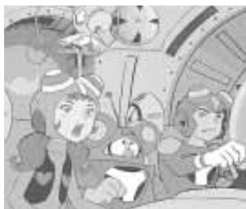
タイムボカン

「科学忍者隊ガッチャマン」・「ハクション大魔王」・「タイムボカン」などで知られるタツノコプロタレントの企画展を開催しています。