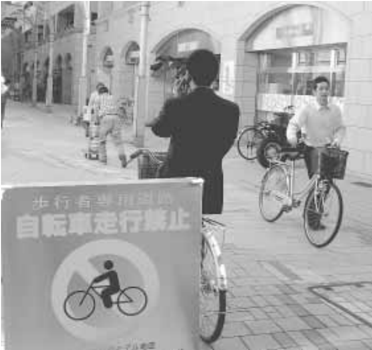
歩行者専用道路では自転車を降りましょう

身近な自転車は、排気ガスを出さず地球にやさしく、健康維持にも効果がある便利な乗り物です。しかしマナー、ルールに反した利用をすると、凶器に変わってしまいます。事故の際には責任を問われる場合もあります。自転車利用者の一人ひとりが責任を持ち、ルールを守ることによって、安全、快適な住みよいまちをつくりましょう。