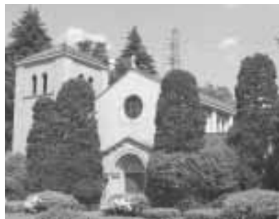
立教女学院・聖マーガレット礼拝堂

立教女学院・聖マーガレット礼拝堂は昭和7年に竣工した鉄筋コンクリート造の礼拝堂です。設計者は聖路加国際病院などの設計をしたJ・W・バガミー二です。 古典的なロマネスク様式を基調としたデザインで、正面入口部に玄関廊を設け、聖堂内部に身廊と側廊を設けた三廊形式になっています。現在でも時折オルガン演奏会などが催され、区民の方にも開放されています。 また、学院にはバガミー二による当時の設計図面一式も保存されており、建築学上きわめて