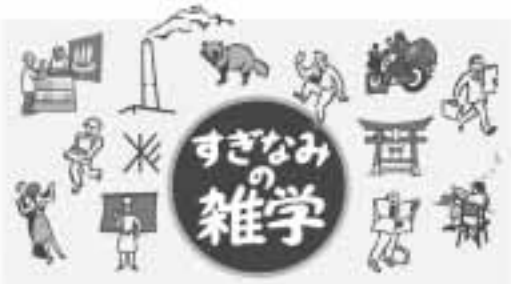
新しい発見がここに

もっとすぎなみを知りたい、教えたい、語り合いたい。そんな願いをかなえるウェブサイト「すぎなみ学倶楽部」が、4月24日にオープンします。 問い合わせは、すぎなみ地域大学担当 ☎3312-2381へ。