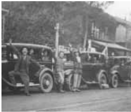
コンテンツの中にはこのような古い写真も