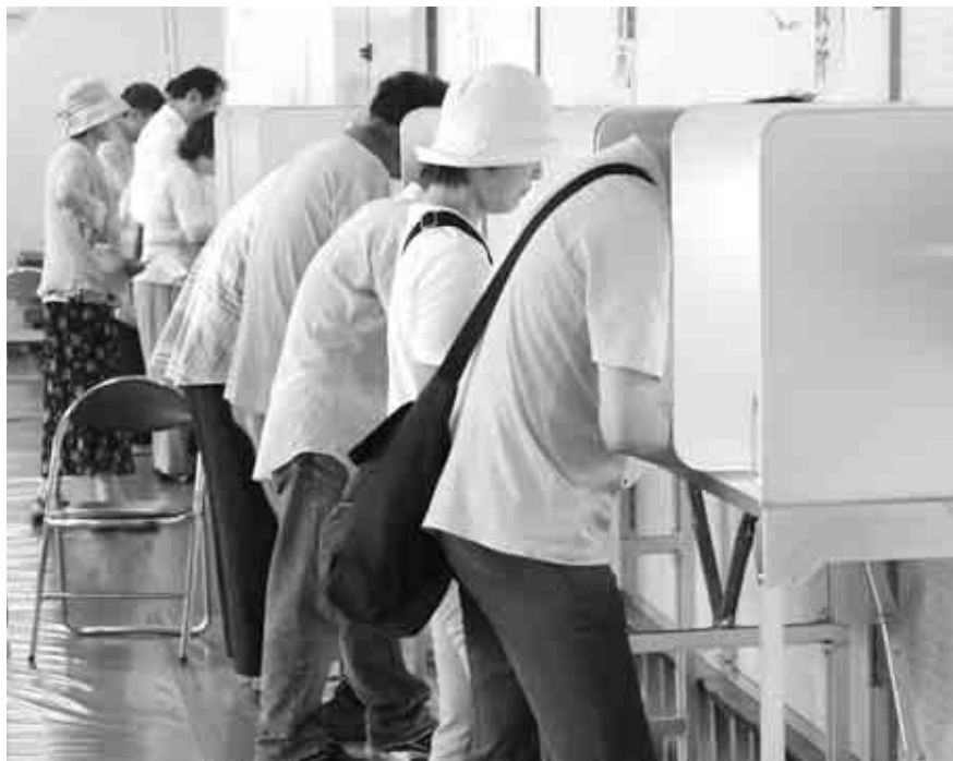
▶みんなの一票を大切に

4月は、統一地方選挙が行われます。本号では、8日(日)に行われる東京都知事選挙についてお知らせします。明日の「東京」のために、あなたの1票を忘れずに投票しましょう。——問い合わせは、選挙管理委員会事務局へ。