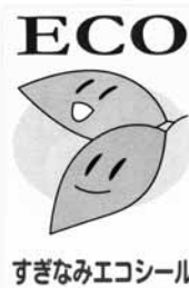
すぎなみエコシール

14年11月から四年にわたり、利用いただいたエコシール事業は、レジ袋削減の取り組みを法に取り込んだ、容器包装リサイクル法の改正や、区におけるレジ袋有料化を柱とする地域自主協定の締結と実証実験の実施を踏まえ、終了することになりました。