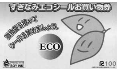
▲エコシールお買い物券の利用は2月28日までになります

エコシールの交付は18年末で終了しましたが、エコシールを二五枚集めてはったお買い物券(エコ券)は2月28日(水)まで利用できます。 エコシールは二五枚集まらなると、お買い物券になりません。しかし、皆さんのご配慮の積み重ねが、我々の生活環境を良好に維持することにつながって