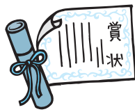
(18年度 杉並区功労表彰者) (敬称略)