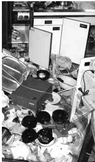
▶震災直後の住宅内

地震による被害を最小限にとどめるには、一人ひとりの自主的な防災活動が重要です。地震に対する備えをもう一度確認しましょう。 建物が無事でも、家具類の転倒・落下で多くの方が犠牲になっていきます。避難路がふさがれないように家具の置き方・場所を見直し、家具を固定することで室内の安全を高めましょう。 区防災課