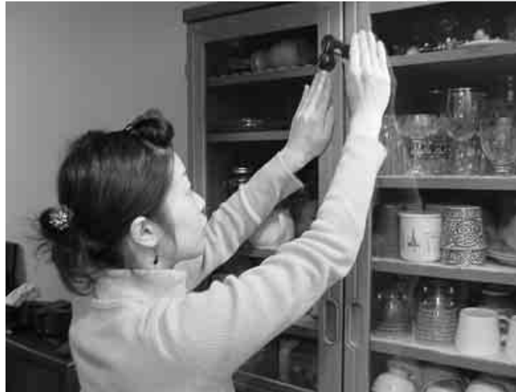
▲食器の飛び出しを防ぎましょう