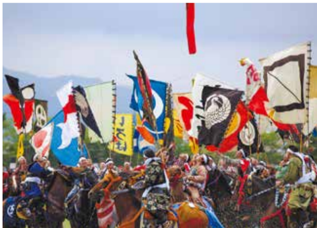
▲相馬野馬追

区交流自治体・南相馬市では、5月の最終土～月曜日の3日間、相馬野馬追が開催されます。すぎなみ学倶楽部では、野馬追にまつわる話のほか、区民ライターが南相馬市の皆さんに伺った市の魅力を紹介する記事を公開しています。伝統の祭事・豊かな自然を満喫しに出かけてみませんか？