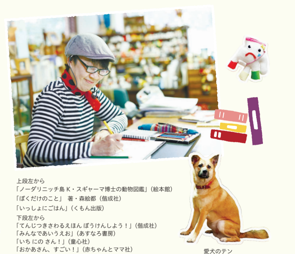
上段左から 「ノダリニッチ島 K・スギヤマ博士の動物図鑑」(絵本館) 「ぼくだけのこ」 著・森絵都 (偕成社) 「いっしょにごはん」(くもん出版) 下段左から 「てんじさきさわるえほん ぼうけんしよう!」(偕成社) 「みんなであいうえお」(あすなろ書房) 「いちにのさん!」(童心社) 「おかあさん、すごい!」(赤ちゃん和妈妈社)