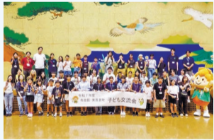
▲東吾妻町子ども交流会