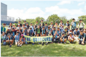
▲名寄市子ども交流会

時 場 右表のとおり 対 区内在住の小学5・6年生で全日程および親子説明会に参加できる方(過去に同交流会・杉並区名寄自然体験交流に参加した方を除く) 定 各16名(各学年8名程度。抽選) 申 詳細は、区HP(右下2次元コード)参照/期間=5月23日～6月7日 問 児童青少年課事業係 ☎3393-4760 他 次世代育成基金活用事業に参加経験のない方を優先