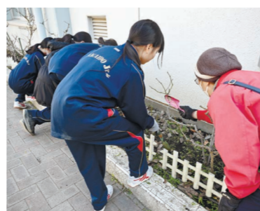
▲アンネのバラ委員会の生徒

バラの世話をするアンネのバラ委員会の生徒たちの姿はとても頼もしいと思います。バラを通して平和を考えると、世界・社会という大きな部分ばかりでなく、例えば友達のいいところを見つけるとか、仲間とお互いを尊重し合うとか、そんな身近な平和を振り返り、考えてくれたらうれしいです。彼らが大人になったとき、きっと平和をつくり出す人になってくれると期待しています。