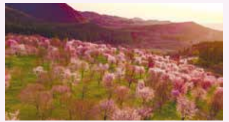
▲桜峠の3000本の大山桜

区の交流自治体である福島県北塩原村の対象施設で、宿泊・飲食料などを割引料金で利用できます。利用方法などの詳細は、北塩原村(HP)(右上2次元コード)をご覧ください。