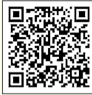
表1のとおり。詳細は、「防災用品あっせんのご案内」(防災課〈区役所西棟6階〉・区民事務所などで配布)・区HP(右2次元コード)をご覧ください。また、同課に見本品を用意しています。