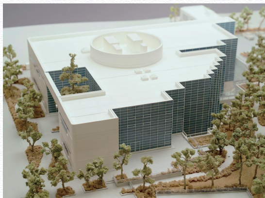
黒川紀章 「中央図書館」 (S=1/200)