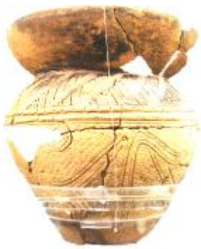
じょうもんどき 縄文土器といひます。

問題② 下の写真は土器という道具です。昔の人はこれを何に使っていたでしょうか？考えたことを書いてみよう！