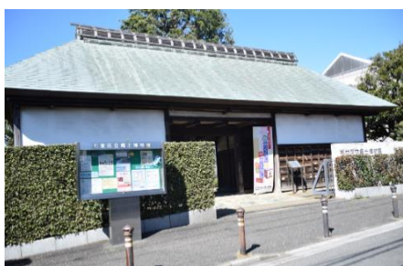
博物館入口(長屋門)

※本案内は小学3年生向けに作成しています。他学年のご利用につきましては、ご相談ください。