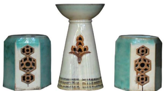
「荻外荘」で使用された陶製の椅子とテーブル

「荻外荘」は内閣総理大臣を務めた近衛文麿の居住した邸宅です。本展では、復原整備の完成を記念して、「荻外荘」創建時の資料や近衛家旧蔵資料を中心に展示し、昭和前期の歴史をたどります。