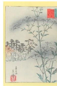
喜翁立祥「三十六花撰 東京大宮八幡 おのこへし」