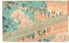
歌川広重(2代) 東都名所 堀之内妙法寺境内

区内にまつわる桜を描いた絵画や工芸品等を展示します。様々な形で桜を愛でていただき、博物館でお花見気分を味わってください。