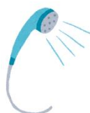
節水シャワーヘッド