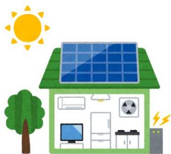
太陽光発電システム

温室効果ガス排出量削減に向け、太陽光発電システム等の導入や省エネルギー対策の助成件数を拡大するとともに、より利用しやすい制度へ見直すなど充実を図ります。