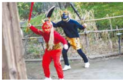
…… いずれも ……

費 各100円(中学生以下無料) 場 郷土博物館(〒168-0061大宮1-20-8) ☎3317-0841