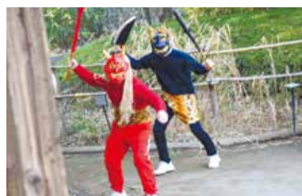
…… いずれも ……

費 各100円(中学生以下無料) 場 郷土博物館(〒168-0061大宮1-20-8) ☎3317-0841