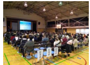
▲用地補償説明会の様子