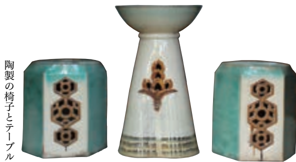
陶製の椅子とテーブル