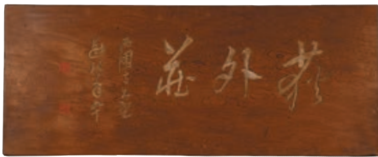
扁額「荻外荘」 昭和13年