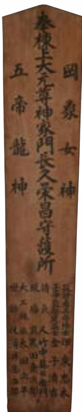
「荻外荘」棟札 昭和2年