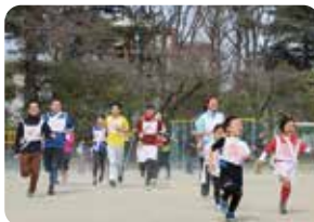
すぎなみ名物ファミリー駅伝