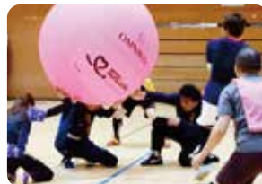
キンボールスポーツ交流大会