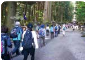
すぎなみ区民歩こう会