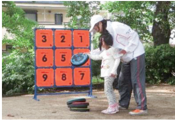
公園でのディスクゲッター体験

地域ごとのグループに分かれ、日頃スポーツをあまりしない人に向けたプチイベントを企画!どなたでも参加できるよう、身近な公園などでスポーツを始めきっかけづくりのお手伝いをします。