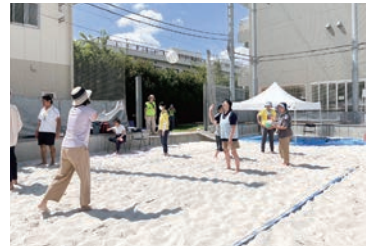
障害者対象のわいわいスポーツ教室