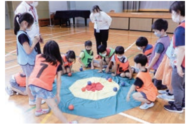
小学校でのポッチャ体験教室

児童館や小学校、地域からの依頼に応じ、レクリエーション種目やポッチャなどのパラスポーツ体験・指導を行います。他に区の事業や、大会の運営スタッフ等、幅広く活動しています。