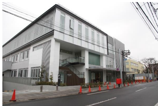
街並みに調和した複合施設棟全景 (右の黄色の建物は荻窪税務署)