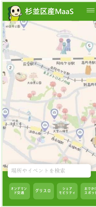
※地図は「すぎなみ巡り」より簡易的に表現