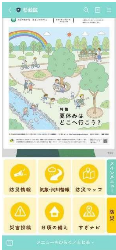
※杉並区LINE公式アカウントより