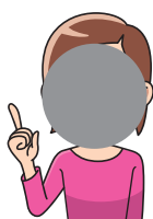
真ん中が 見えない