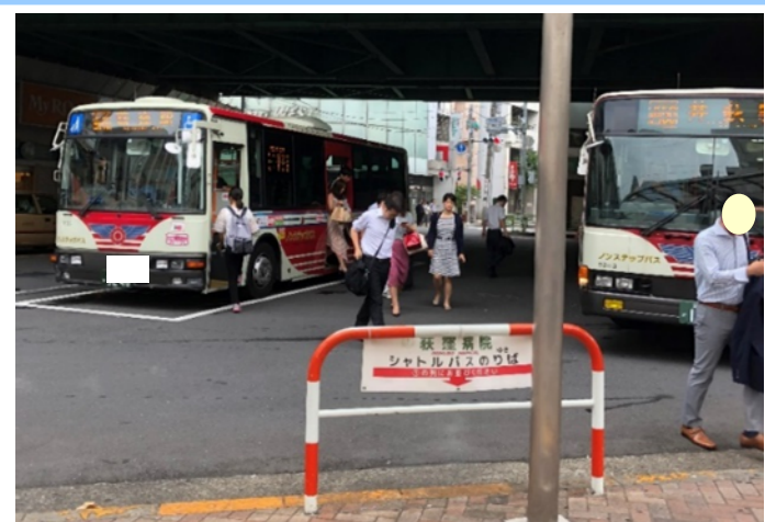
車道上で乗降しており危険です