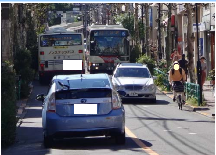
大型車両のすれ違いに支障 自転車の通行が困難です