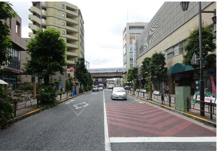
駅へのアクセスを向上し 拠点間の連携を図ります