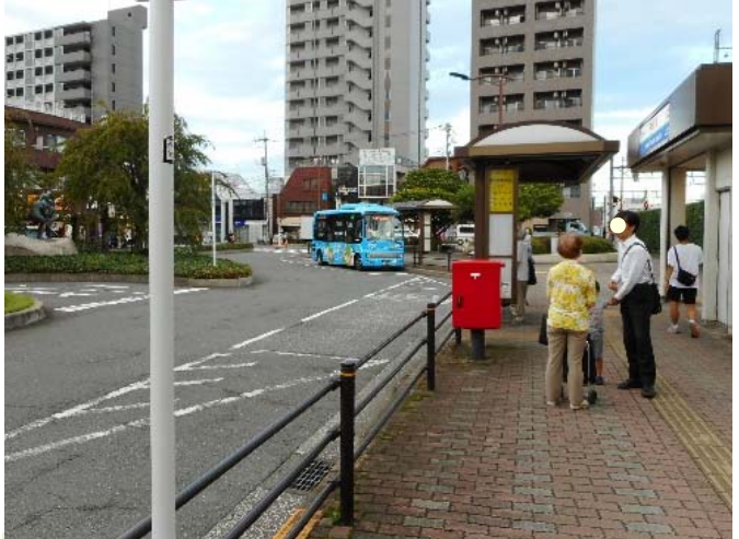
駅前広場機能を高め 拠点の形成を図ります