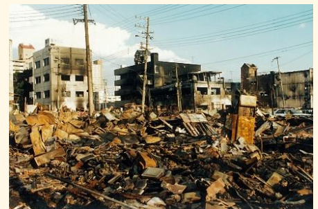
阪神淡路大震災（神戸市長田区）

阪神・淡路大震災の震災復興研究プロジェクトや東京での 防災対策に関わったご経験から、地域の防災まちづくりにつ いて、お話を伺います。