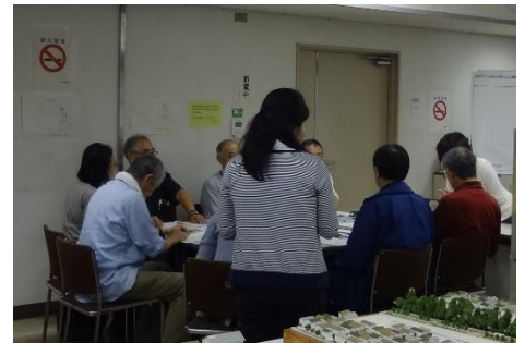
ワークショップ方式での意見交換イメージ