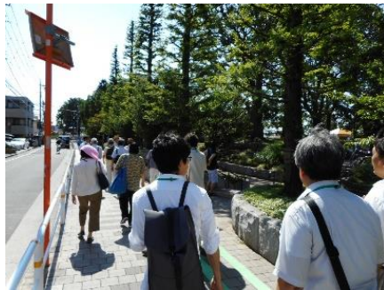
「まち歩き」イメージ