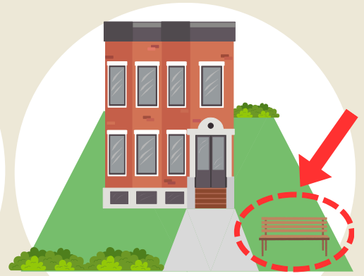
共同住宅の オープンスペース