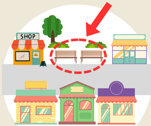
商店街の 空きスペース