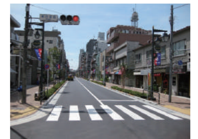
(事例写真) 区道の拡幅整備のイメージ