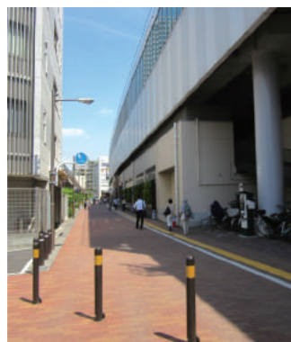
(事例写真) 側道のイメージ