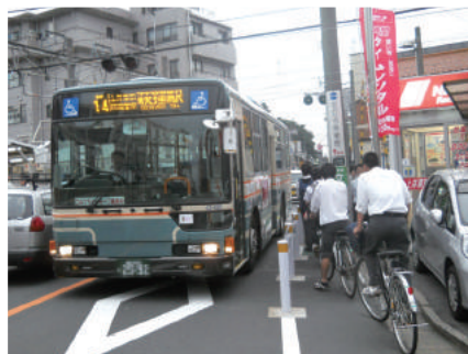
道幅の狭いバス通り