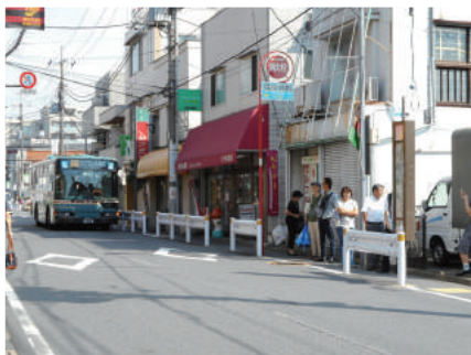
駅から離れているバス停

こうした課題を解決し、駅周辺の利便性及び安全性の向上を図るため、駅前広場と接続する道路の拡幅整備等を骨子とした「上井草駅周辺道路・交通施設整備計画（以下「整備計画」という。）」を策定しました。