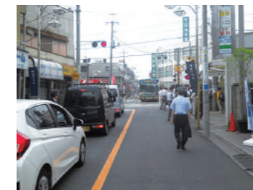
現在のバス通り(警察通り)