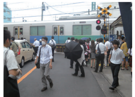
滞留スペースのない駅前