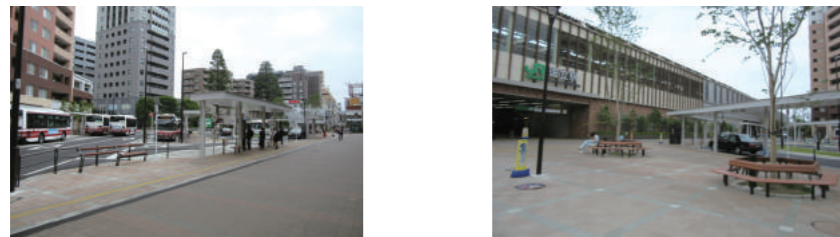
(事例写真) 駅前広場のイメージ