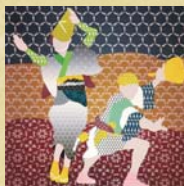
2 阿波踊り柄図屏風