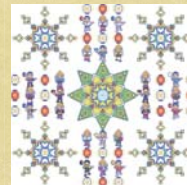
14 高円寺どっと曼荼羅