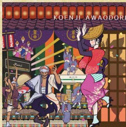
S1 【最優秀賞】 蝉時雨