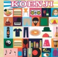
17 にぎやかな中にもこころ良さを持つ街、高円寺