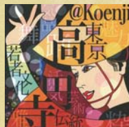
1 高円寺コンセプト