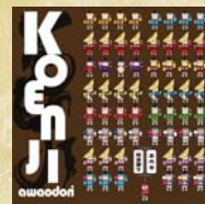
8 Iconic-Koenji Awaodori