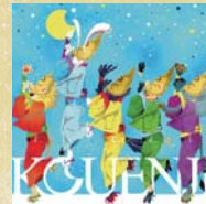
16 トリドリ フドル コウエンジ