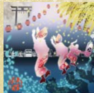
5 おどる街 高円寺