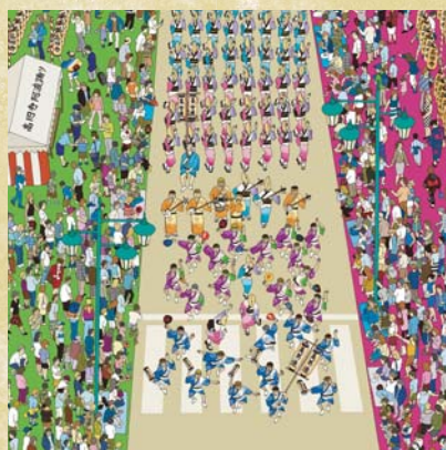
S2 【最優秀賞】 THE OUR 踊り KOENJI