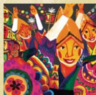
S5 【優秀賞】 高円寺に舞う