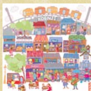
S4 【優秀賞】 マイタウン高円寺