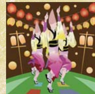
13 Awa Odori in Koenji