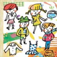
10 Furugi Paradise