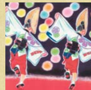
12 ねっ、描っているでしょう