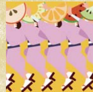
15 いろとりどり阿波踊り