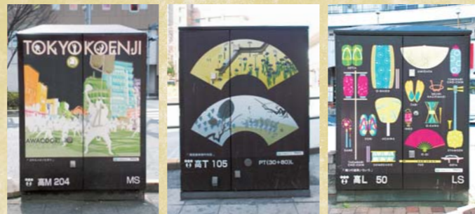
A コウエンジノヒカリ B 扇面昼夜高円寺図 C 踊りの道具いろいろ