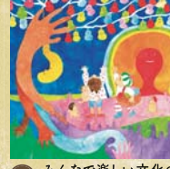
20 みんなで楽しい文化の実を収穫しよう!