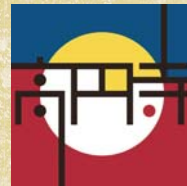
24 高円寺 Round and round