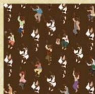
S3 【優秀賞】 踊る阿呆