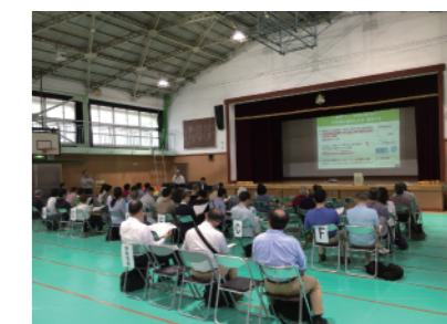
第3回西荻窪駅周辺まちづくり懇談会の様子

また、より具体的な検討を進めるため、今年度の議論の柱となるテーマの設定について、意見交換を行いました。