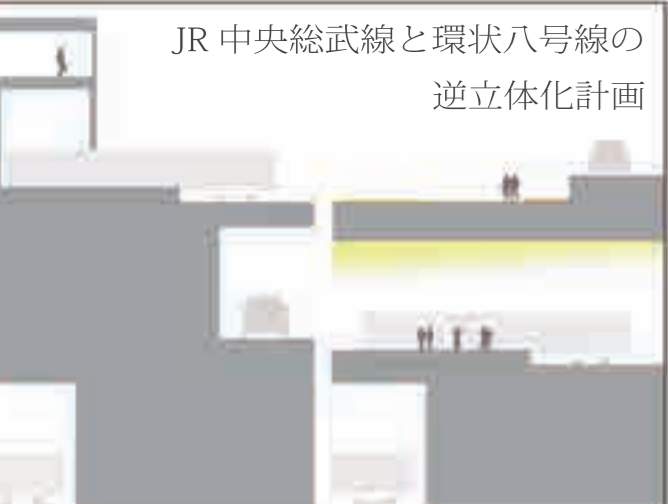
JR 中央総武線と環状八号線の 逆立体化計画