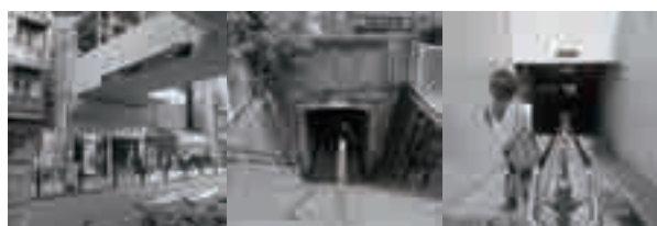
地下道や高架橋が張り巡らされ、殺伐とした印象