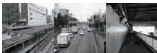
まちの大きな動線によって分断された、現在の収穫