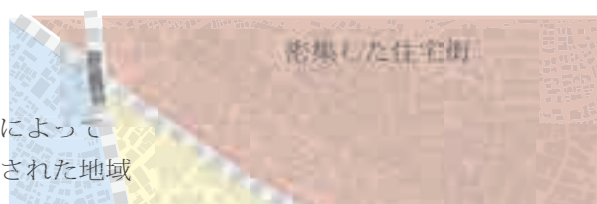
道路によって分断された地域

駅前を中心に収穫の要素を繋ぐ まちを切り離していた線路が 収穫の豊かな生活を生み出す