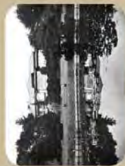
創建時の荻外荘(個人蔵)