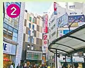
2 荻窪タウンセブン 戦後にできた新興マーケットが、1981年に7階建てビルになりました。屋上からの風景と魚屋が杉並百景です。