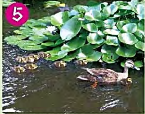
5 天沼弁天池公園 かつて天沼弁天池と呼ばれる湧水池があり、中ノ島に弁天様が祀られ雨乞いも行われました。カルガモ親子がいるかも。