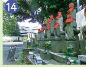
14 光明院 通称「荻寺」と呼ばれ、荻窪の地名の由来と言われていています。南北朝期の開創で、多くの仏像・石仏があります。