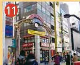
11 荻窪南口 仲通り商店街 荻窪駅南口から南へ環八通り近くまで450m続く、何となく懐かしくほっとする活気もある商店街です。