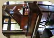
スライムウェイ社のピアノ