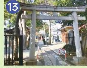
13 荻窪白山神社 中世にはあったと言う旧下荻窪村の鎮守です。都内有数の大神輿・大太鼓があります。女みこしが杉並百景です。