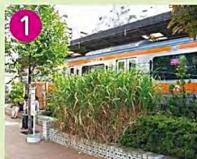
1 荻窪駅の「荻」 荻窪の地名の由来となった、水辺の湿地に生えるオギが植えられています。ススキに似た大型の多年草です。