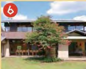
6 角川庭園 角川源義氏の旧邸宅を活かした庭園です。園内の幻戯山房は国の登録有形文化財です。