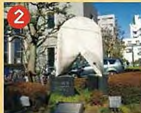
2 オーロラの碑 かつてここにあった区立公民館から原水爆禁止運動が発祥したことを記念して建てられました。