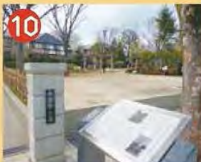
10 与謝野公園 与謝野鉄幹・晶子夫妻の旧居跡につくられた公園です。夫妻の歌碑があり、近くの桃二小の校歌は晶子の作詞です。