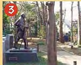
3 読書の森公園 区立中央図書館に隣接し木陰で本が読める公園です。図書館側にガンジー像が建てられています。