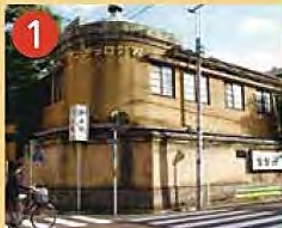
1 杉並「まち」デザイン賞 西郊ロッテング 昭和初期に贈り付き高級下宿として建てられた建物です。国の登録有形文化財です。