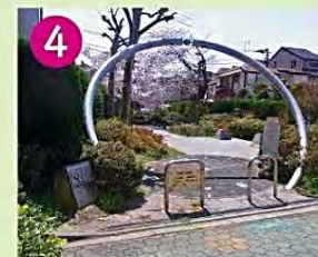
4 ときのオアシス 天沼もえぎ公園に併設された休憩所で、時の門・地界の天庭・日時計があります。すぐ隣に自然生態園もあります。