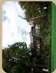
高瀬公園からの眺め