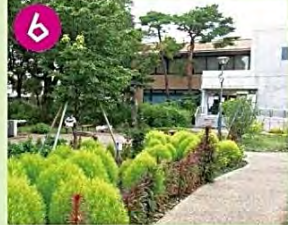
6 郷土博物館分館 郷土博物館の分館として天沼弁天池公園内に建てられ、主として企画展や区民参加型展示が行われます。