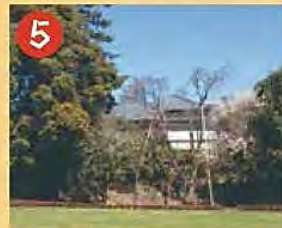
5 荻外荘(国指定史跡) 荻外荘は、昭和戦前期に総理大臣を3度務めた政治家、近衛文麿の別邸です。平成28年3月に国の史跡に指定されました。