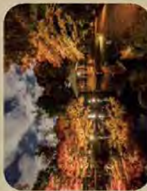
大田黒公園ライトアップ