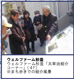
ウェルファーム杉並 ウェルファーム杉並「太宰治紹介コーナー」(4F) ※まち歩きでの紹介風景