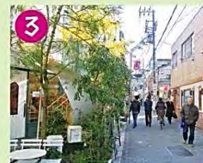
3 教会通り商店街 大正6年に設立された天沼教会が奥にあり、昭和の雰囲気と建物が残る、狭い通りの賑やかな商店街です。