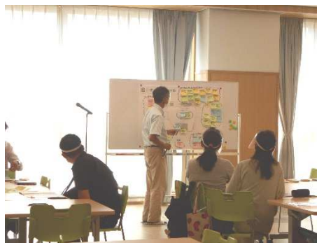
WS グループ発表の様子