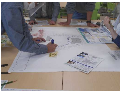
WS グループワークの様子