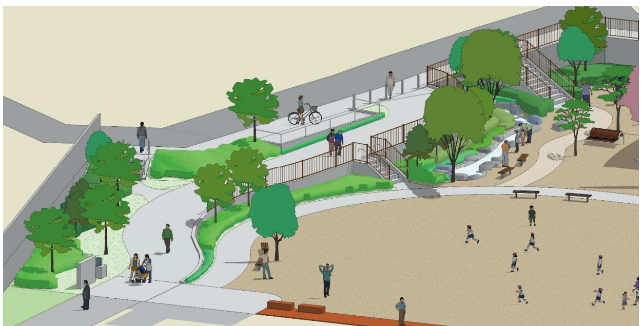
イメージ図(東側園路)