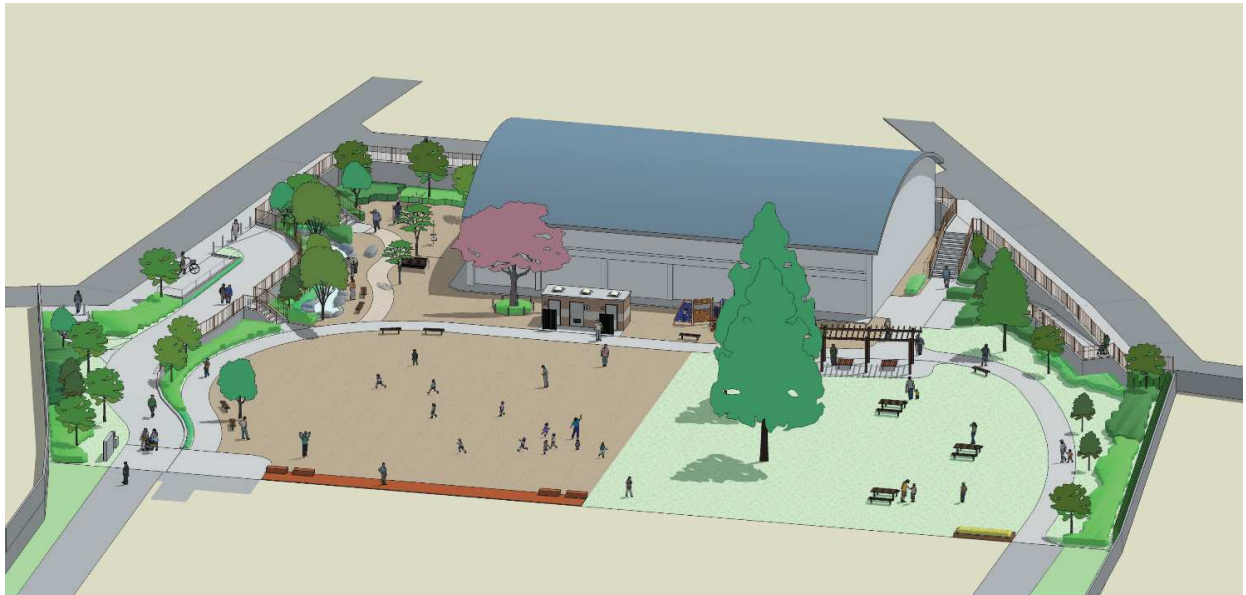
イメージ図(北側からの鳥かん)