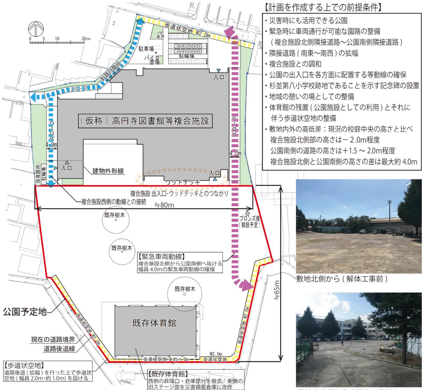
計画地概要図・条件図