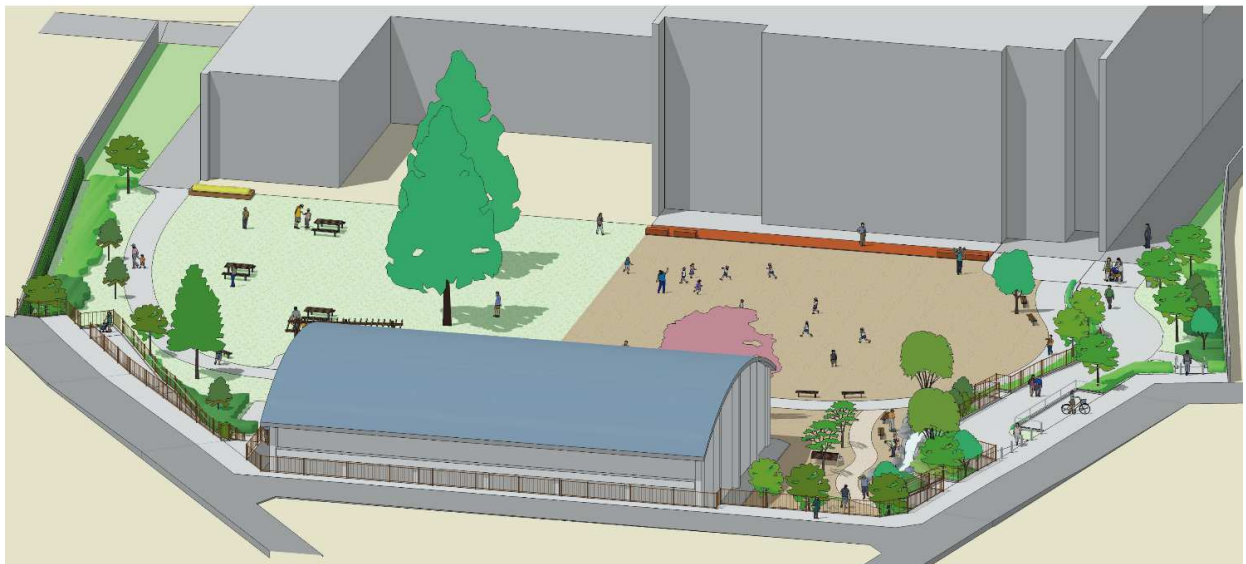
イメージ図(南側からの鳥かん)