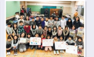
▲杉並・テキサス交流プロジェクト