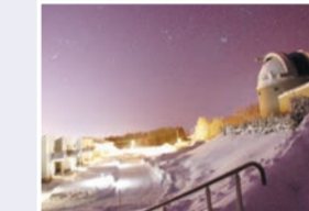
▲小学生名寄自然体験交流事業