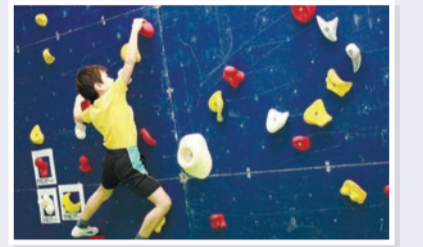
▲チャレンジアスリート

基金創設の24年度より区内の子どもを対象とした区の事業に基金を活用しています。また、27年度からは民間の団体等が実施する子どものための事業に対しても基金から助成しています。