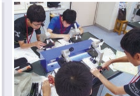
▲サイエンスホッパーズ科学実験教室