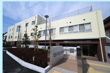
コミュニティふらっと成田

第4回では、整備する集会施設の候補の一つであるコミュニティふらっとを見学しました。2チームに分かれて、コミュニティふらっと成田と東原を見学し、見学後は、グループで感想を共有しました。