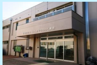
コミュニティふらっと東原