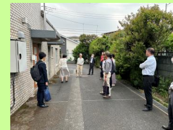
▲宮前図書館・さざんかステップアップ教室「宮前教室」