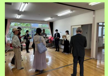
▲大宮前保育園・ゆうゆう大宮前館